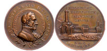
1011 Abbildung verkleinert