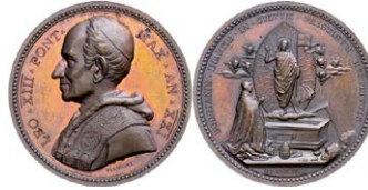
1005 Abbildung verkleinert