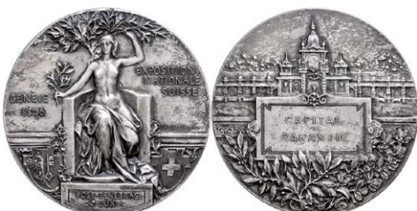
959 Abbildung verkleinert