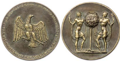
1499 Abbildung verkleinert