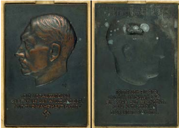
1497 Abbildung verkleinert