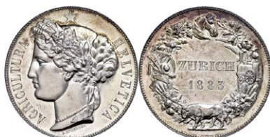
957 Abbildung verkleinert