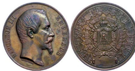
904 Abbildung verkleinert