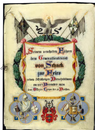
1530 Abbildung verkleinert