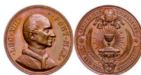
966 Abbildung verkleinert