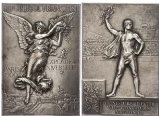
1122 Abbildung verkleinert