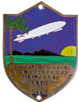
1071 Abbildung verkleinert