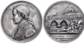
878 Abbildung verkleinert