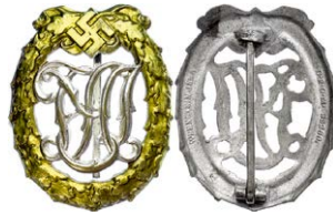
1418 Abbildung verkleinert