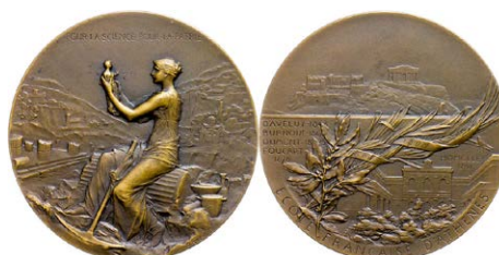
1004 Abbildung verkleinert