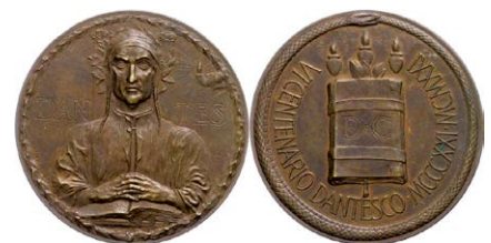
1242 Abbildung verkleinert