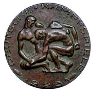
1062 Abbildung verkleinert