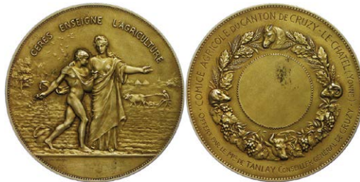
1238 Abbildung verkleinert