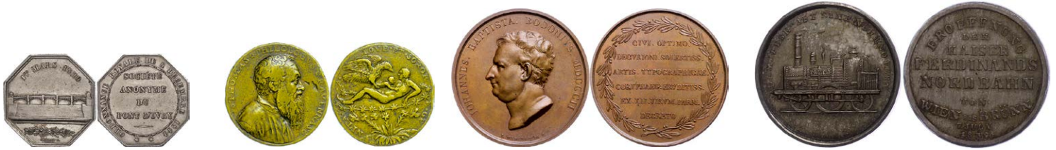
893 Abbildung verkleinert