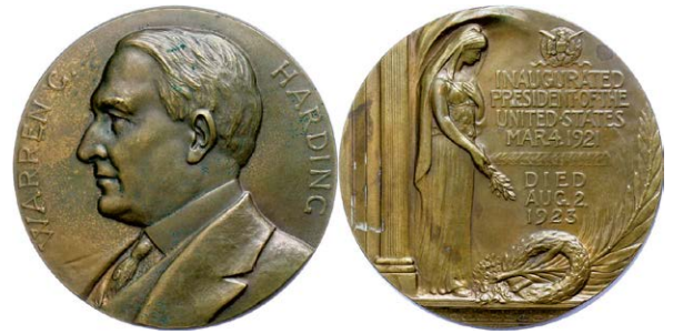
1249 Abbildung verkleinert