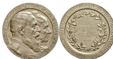
1040 Abbildung verkleinert