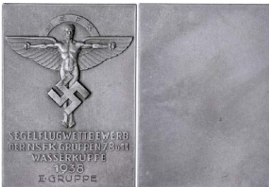
1513 Abbildung verkleinert