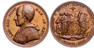
1134 Abbildung verkleinert