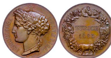
956 Abbildung verkleinert