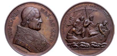
929 Abbildung verkleinert