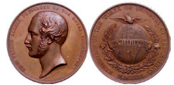
899 Abbildung verkleinert