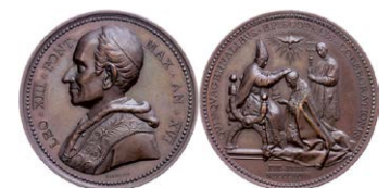
995 Abbildung verkleinert