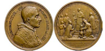
1218 Abbildung verkleinert