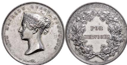
918 Abbildung verkleinert