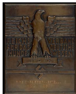
1496 Abbildung verkleinert