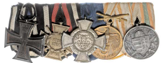
1410 Abbildung verkleinert