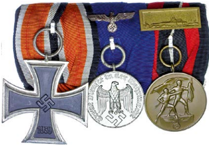
1415 Abbildung verkleinert