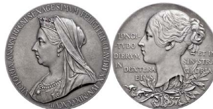
999 Abbildung verkleinert