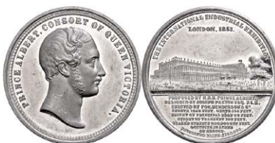
901 Abbildung verkleinert