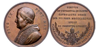
951 Abbildung verkleinert