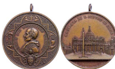
989 Abbildung verkleinert