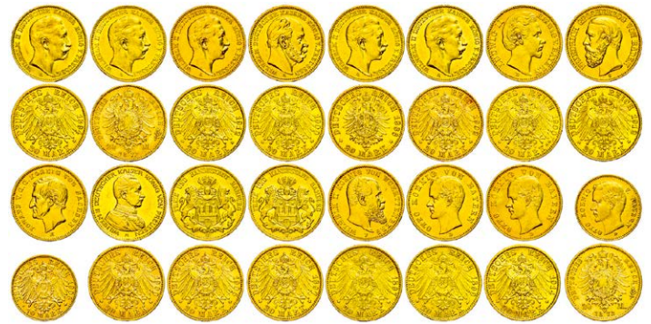
1379 Abbildung verkleinert