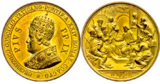
930 Abbildung verkleinert