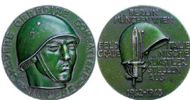
1520 Abbildung verkleinert