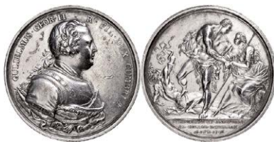
852 Abbildung verkleinert