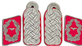
1442 Abbildung verkleinert