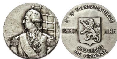
1288 Abbildung verkleinert